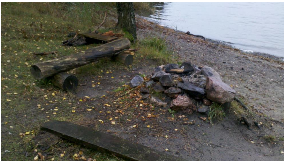
Fig. 1 Otillåten eldning vid Sandängen.

Otillåten eldning förekommer vid Sandängen, fig. 1. Kommunen planerar att iordningställa en permanent eldningsplats där.