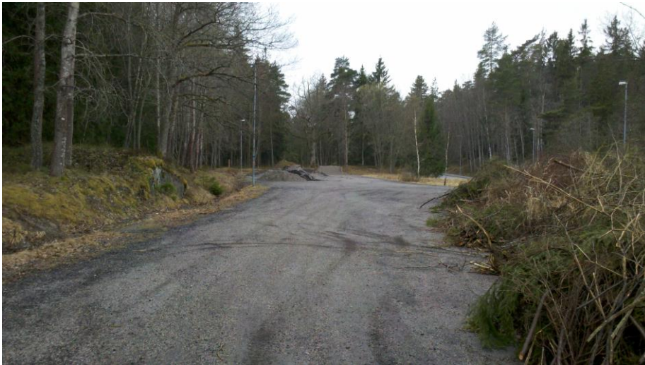
Fig. 1 Upplag vid huvudentréns parkering.

Det finns ett större upplag av sand, grus etc. på parkeringsplatsen vid huvudentrén, fig. 1. Detta ger ett ovårdat intryck samt tar parkeringsplatser i anspråk. Upplaget bör bortskaffas snarast.