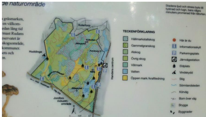
Fig. 1 Röd punkten saknas på informationstavla vid Glimmervägen.